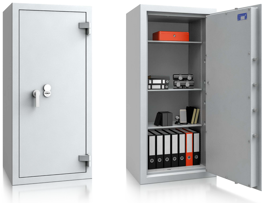
Modell EN 0-160