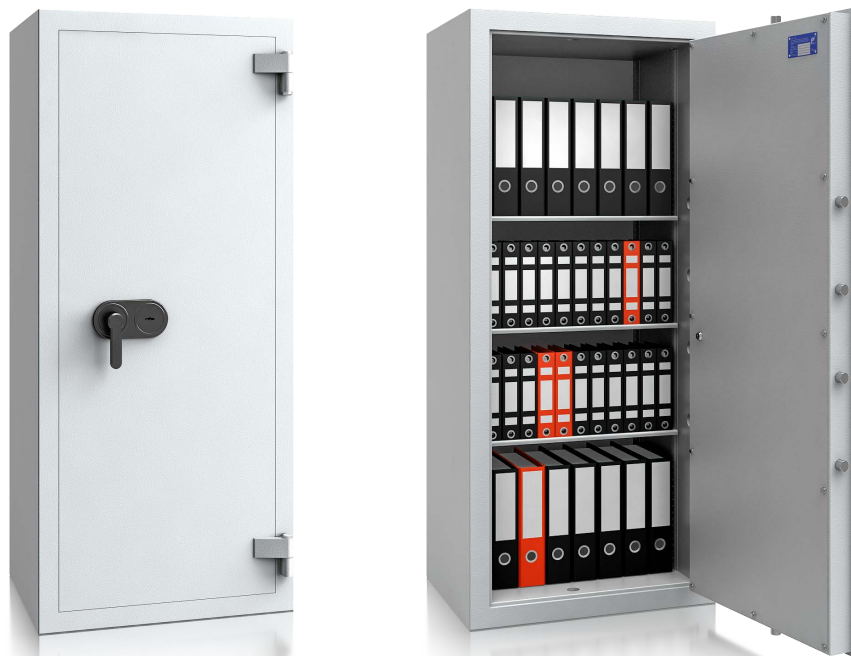
Modell EV I-160