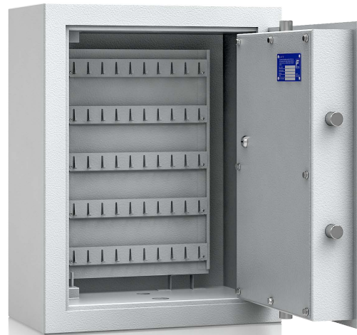
Modell MST I-100