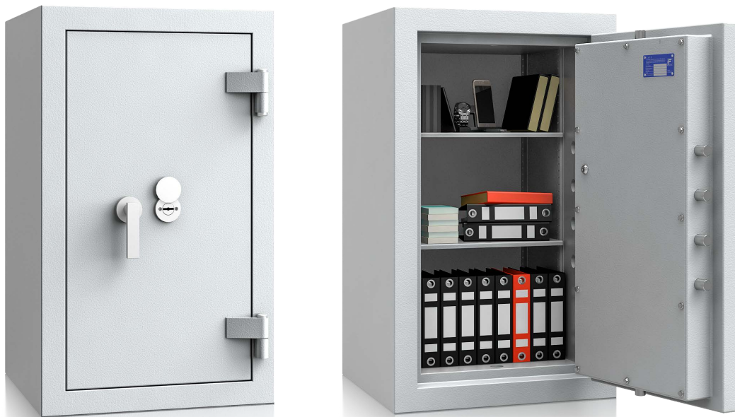
Modell EN II-100