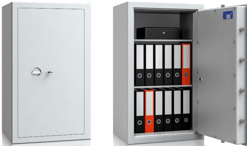
Modell MVO 10