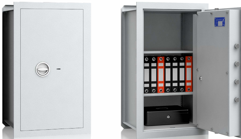
Modell VNO 8