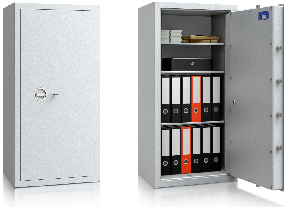
Modell MNO 12